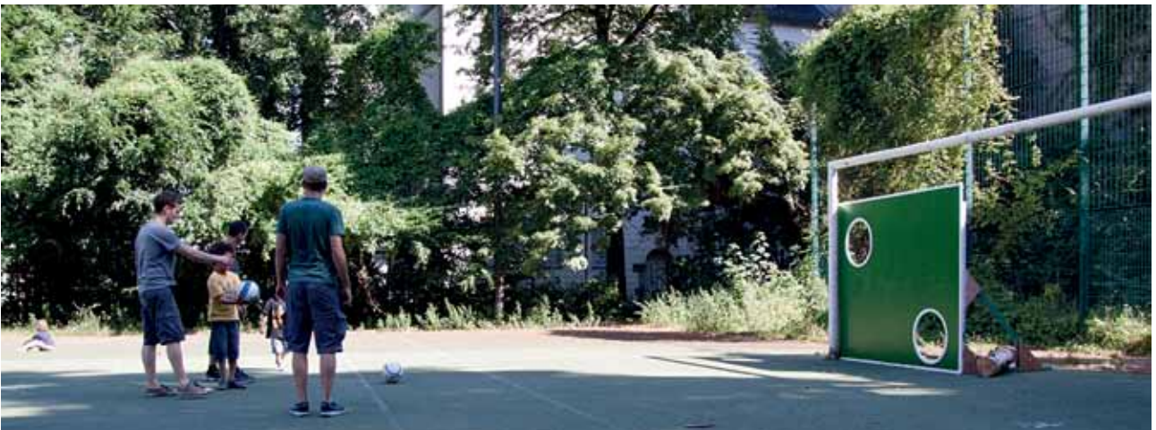
TORWANDSCHIESSEN NACH DER GARTENARBEIT IM GEMEINSCHAFTSGARTEN GLOGAUER