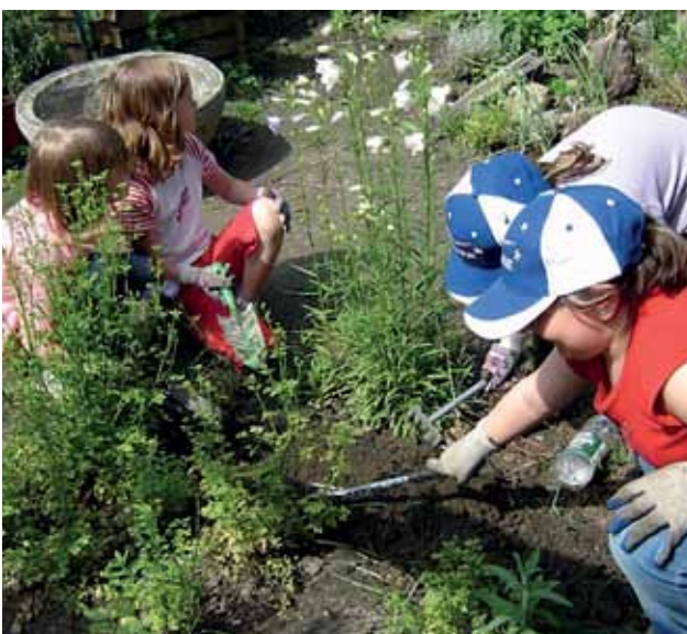
MOTIVIERTE GÄRTNERINNEN IM MÄDCHENGARTEN GELSENKIRCHEN

Eine Stärke solcher bürgerschaftlicher Aktivitäten ist es, dass sich auch Bevölkerungsgruppen beteiligen, die in den üblichen Partizipationsprozessen – zum Beispiel bei kommunalen Planungen – eher unterrepräsentiert sind. Anhand dieser überschaubaren, direkt den Alltag der angesprochenen Personen betreffenden Aktivitäten, wird hier partizipatives Handeln nahe gebracht und eingeübt. Dies kann positive Auswirkungen beispielsweise auch auf das Vereinsleben und weitere gemeinschaftliche Aktivitäten im Umfeld haben. Und es wird die Verantwortung für die Flächen aber auch für das soziale Miteinander im Quartier gestärkt.