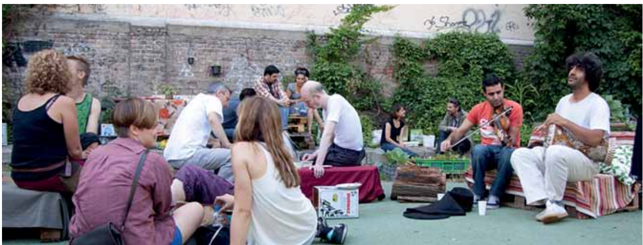
FESTE GEHÖREN ZUM URBANEN GÄRTNERN DAZU. HIER: SOMMERFEST IM GEMEINSCHAFTSGARTEN GLOGAUER

Bürgerschaftlich getragene Gartenprojekte müssen meist mit wenig Geld auskommen und legen oft viel Kreativität und Improvisationskunst an den Tag, ihren Garten möglichst kostengünstig auszustatten und zu unterhalten: Nutzung von Regenwasser, Herstellung eigenen Komposts,