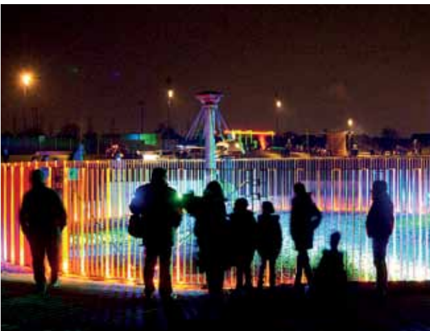
LICHTERSPIEL ZUR ERÖFFNUNG DES LIPPEPARKS HAMM