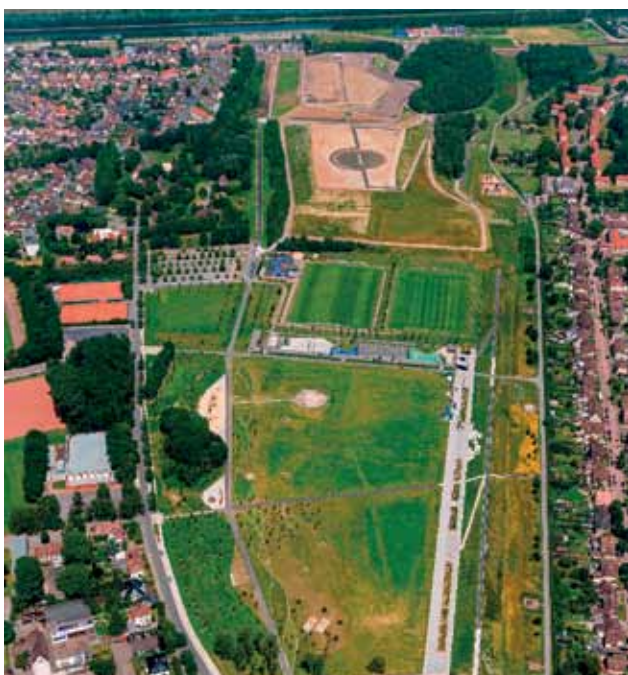
DER LIPPEPARK HAMM ENTSTAND MIT INTENSIVER BÜRGERBETEILIGUNG

Mit „klassischer Bürgerbeteiligung“ ist die Beteiligung der Bürgerschaft an Stadtgestaltungsprojekten gemeint, die von Politik oder Verwaltung angestoßen werden. In klassischen Bürgerbeteiligungsprozessen dominieren meist gut gebildete, finanziell unabhängige Menschen, die sehr gut ihre Bedürfnisse und Wünsche formulieren können und mit der hiesigen Diskussionskultur vertraut sind. Dagegen sind viele Bevölkerungsgruppen unterrepräsentiert, wie untere Einkommensschichten, Bürgerinnen und Bürger mit Migrationshintergrund, und auch Jugendliche (Reinert 2003). Im Sinne von Umweltgerechtigkeit gilt also, eine breitere Bevölkerung zu aktivieren sich in gesellschaftliche Prozesse einzubringen. Dies erfordert flexiblere Ansätze: weniger