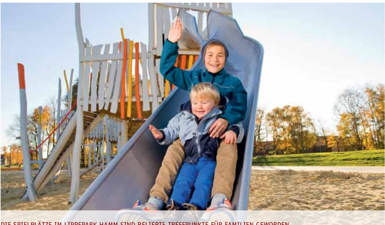
DIE SPIELPLÄTZE IM LIPPEPARK HAMM SIND BELIEBTE TREFFPUNKTE FÜR FAMILIEN GEWORDEN

Der oben beschriebene Prozess birgt jedoch auch eine Bedrohung des Quartiers. Wenn die Aktivitäten erfolgreich sind und die Attraktivität der wohnortnahen Grün- und Freiräume steigt, können die Miet- und Bodenpreise in einem Quartier erheblich ansteigen. Gebäude, die vorher nicht zu verkaufen oder zu vermieten waren, können plötzlich attraktiv werden, Brachflächen und Baulücken können für eine bauliche Verwertung interessant werden. Das ist im Sinne der Stadt- und Quartiersentwicklung natürlich zu begrüßen und wirkt sich wirtschaftlich positiv auf die kommunalen Kassen aus. Allerdings birgt es die Gefahr, dass genau die sozial benachteiligten Bevölkerungsgruppen, in deren Wohnumfeld attraktivitätssteigernde Maßnahmen so dringend notwendig waren, in der Folge wegen Mietpreissteigerungen, meist im Zuge von Sanierungsmaßnahmen, aus ihrem Quartier verdrängt werden. Neben politischen Gegenmaßnahmen ist es wichtig, Grünflächen und vor allem auch Projektflächen von bürgerschaftlichen Initiativen langfristig zu sichern, damit diese auch bei einer Bodenwertsteigerung nicht vermarktet werden.