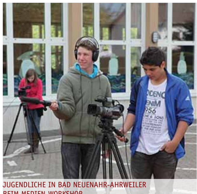
JUGENDLICHE IN BAD NEUENAHR-AHRWEILER BEIM MEDIEN-WORKSHOP