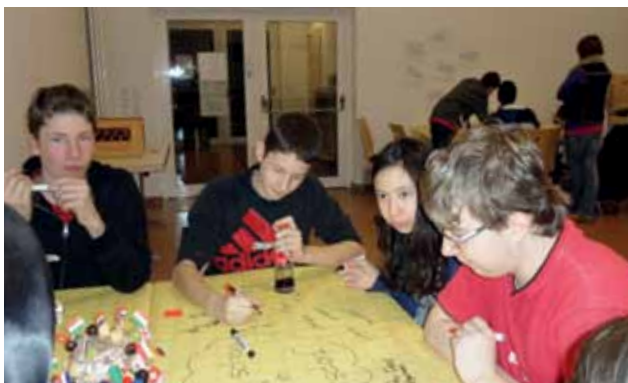
KINDER SAMMELN IDEEN BEI DER ZUKUNFTSWERKSTATT

Die erste Runde der Zukunftswerkstätten 2011/2012 verlief bereits sehr erfolgreich. Es wurden zahlreiche Projektideen entwickelt und entsprechend der Prioritäten der Kinder und Jugendlichen – und in Abhängigkeit von den bewilligten Mitteln aus der Dorferneuerung – nach und nach umgesetzt. In einem Ortsteil funktionierte ein Jugendliche z.B. einen Wohnwagen in einen Jugendraum um, in einem anderen Ortsteil gestalteten sie ein Ortsschild aus Motorradschrott, um die Motorradfahrer vorsichtig auf die Geschwindigkeitsbegrenzung hinzuweisen. Daneben entstanden unter der Planungs- und Durchführungsherrschaft von Kindern und Jugendlichen kreative und sportliche Projekte, wie z.B. Bolzplätze, Konzerte und Graffiti-Projekte. Wenn möglich wurden lokalen Akteure einbezogen, wie z.B. Ortsvorsteher, Ortsbeirat, Vereine etc.