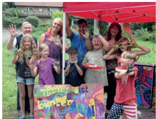
ZUKUNFTSWERKSTATT IM ORTSTEIL GIMMIGEN