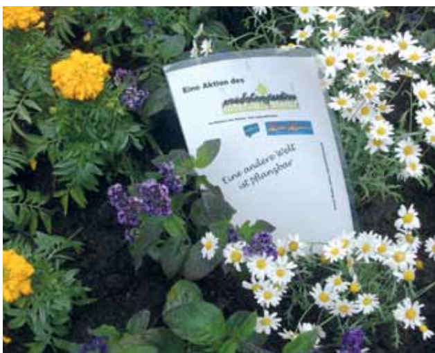
BEI PFLANZAKTIONEN VERSCHÖNERT DER MÄDCHENGARTEN GELSENKIRCHEN GRÜNFLÄCHEN IM STADTEIL

Umweltgerechtigkeit geht selten zu Lasten von Neubausiedlungen oder anderen Quartieren, die sich vor allem gut situierte Menschen leisten können. Vielmehr geht es um die weniger beliebten Quartiere einer Stadt, die z.B. als „soziale Brennpunkte“ wahrgenommen werden – hierhin