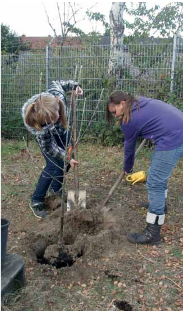
BAUMPFLANZUNG IM MÄDCHENGARTEN GELSENKIRCHEN

Dies setzt jedoch voraus, dass die Ergebnisse auch tatsächlich zeitnah umgesetzt werden. Wenn ein Planungsergebnis, das mit 12-jährigen erarbeitet wurde, erst zwei Jahre später umgesetzt wird, haben sich Lebenswelt und Anliegen der ursprünglichen Planungsbeteiligten möglicherweise bereits grundlegend verändert. Zur Anerkennung und Wertschätzung des Engagements von Kindern und Jugendlichen gehört daher zwingend, dass deren Beitrag sich zügig in sichtbaren Veränderungen widerspiegelt. Nur so können sie das notwendige Vertrauen in ihre eigenen Kompetenzen und in ihre Gestaltungsmöglichkeiten in politischen Prozessen entwickeln.