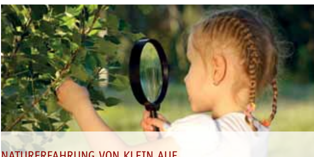
NATURERFAHRUNG VON KLEIN AUF

Gerade Kinder beispielsweise in Großwohnsiedlungen einer Großstadt haben oft fast keine Gelegenheit, Wälder oder andere Naturräume kennenzulernen. Auch Angebote von Naturschutzverbänden oder anderen Gruppen werden gerade von Kindern aus Familien mit geringeren finanziellen Möglichkeiten seltener wahrgenommen, selbst wenn diese kostenfrei angeboten werden. Das direkte Wohnumfeld ist oft die einzige Gelegenheit Tiere und Pflanzen der heimischen Natur kennenzulernen – deren Vorhandensein ist der erste und wichtigste Schritt in Richtung Naturerfahrung und Grundvoraussetzung für Angebote der Umweltbildung. Es genügt schließlich nicht, darüber zu schimpfen, dass Kinder zu viel Zeit vor Fernseher und Computer verbringen – sie brauchen auch Alternativen vor der eigenen Haustür. Naturnahe Grünflächen mit viel Raum für eigene Entdeckungstouren und selbstbestimmtes Spielen lockt Kinder immer noch nach draußen. Persönliche Erfahrungen und emotionale Erlebnisse in der Natur in der Kindheit können sich zudem positiv auf das Umweltverhalten sowie die Akzeptanz und auch die Unterstützung von Naturschutzmaßnahmen im späteren Leben auswirken.