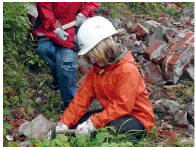
MÄDCHEN PACKEN AN IM LIPPEPARK