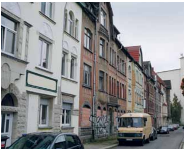
KEIN PLATZ FÜR GRÜN. DOCH DIREKT GEGENÜBER...

Auch Umweltressourcen sind nicht gleichmäßig und in gleich hoher Qualität über eine Stadt und ihre Quartiere verteilt. In jeder Stadt existieren sogenannte „grüne Stadtteile“, die von Bäumen, Gärten und anderen Grünstrukturen geprägt sind, während in anderen Stadtteilen Grünanlagen Mangelware sind: Öffentliche Parks sind rar, Hausgärten fehlen oder bestehendes Grün ist unattraktiv gestaltet – wie das oft großzügig angelegte und dennoch kaum genutzte Abstandsgrün. Dabei gehen die positiven Effekte von Stadtgrün weit über optische Errungenschaf-