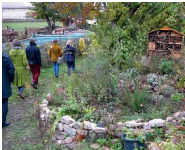
...NATUR UND SOZIALES MITEINANDER IM INTERKULTURELLEN GARTEN ERFURT.