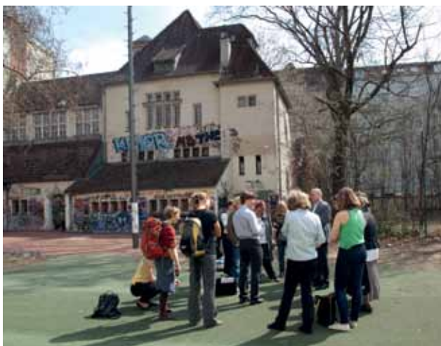
ORTSBESUCH MIT DEM BEZIRKSAMT ZUM START DES GEMEINSCHAFTSGARTENS GLOGAUER

Diese Fragestellungen verdeutlichen auch, dass es nicht darum geht, kommunale Aufgaben an die Bürgerschaft abzugeben und sich so aus den eigenen Verpflichtungen zurückzuziehen. Es geht vielmehr darum, sich gemeinsam mit der Bürgerschaft um lebenswerte und nutzerorientierte Freiräume zu bemühen und dafür auch bürgerschaftli-