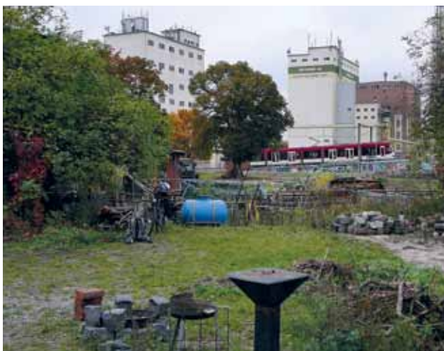
DER INTERKULTURELLE GARTEN ERFURT LIEGT NAHE EINER MALZFABRIK

Solche Initiativen „von unten“ sind gelebte Partizipation und ein Gegenkonzept zur viel diskutierten Anonymität und Individualität einer Stadtgesellschaft. Mit ihrem Engagement z.B. in einem Gemeinschaftsgarten übernehmen die Aktiven Verantwortung für ein Stück ihrer Stadt und identifizieren sich dadurch stärker mit dem eigenen Umfeld. Auch strahlen bürgerschaftliche Projekte auf vielfältige Weise in das Quartier hinaus und treiben mitunter sogar dessen Entwicklung voran. Dies lässt sich gut an den Praxisprojekten in Erfurt und Gelsenkirchen erkennen: Die Häuser rund um den Erfurter Gemeinschaftsgarten galten wegen der früheren Nutzung als Rotlichtviertel, des schlechten Rufs des Viertels und wegen industrieller Lärm- und Geruchsbelastung als schlecht vermietbar. Als kurz nach Zuzug des Gartens einige Wohnhäuser saniert wurden, war der Gemeinschaftsgarten für einige Mieter der Hauptbeweggrund für den Einzug. Auch in Gelsenkirchen hatte das Umfeld um den ersten Standort des Mädchengartens nicht den besten Ruf. Hier erhoffte man sich durch die Ansiedlung verschiedener Gartenprojekte eine Imageverbesserung, um die Vermarktung der Fläche als Neubaugebiet vorzubereiten. Dies funktionierte durch die als positiv wahrgenommene Nutzung so erfolgreich, dass der Baubeginn sogar um ein Jahr vorverlegt wurde.