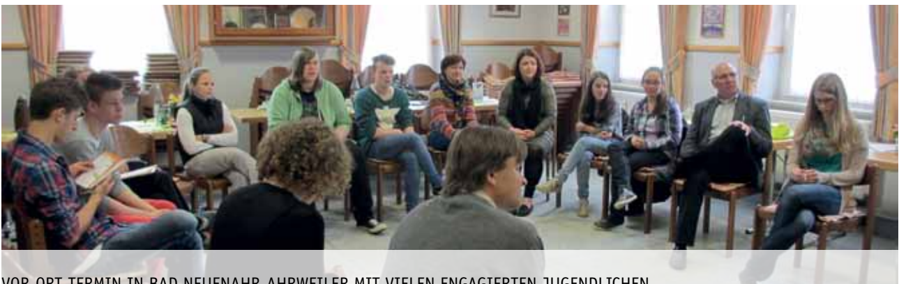
VOR-ORT-TERMIN IN BAD NEUENAHR-AHRWEILER MIT VIELEN ENGAGIERTEN JUGENDLICHEN