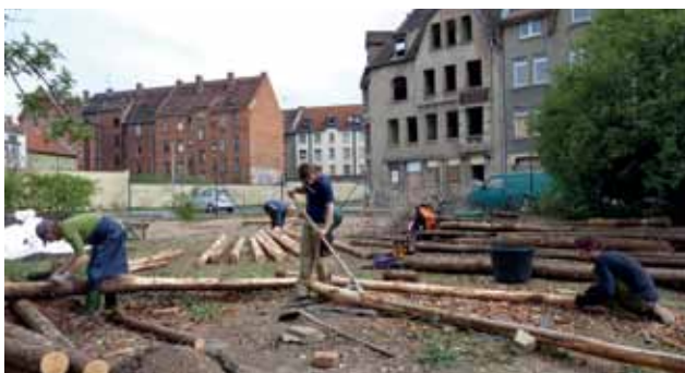
GEMEINSAMER BAU VON HOCHBEETEN

Durch die Umzüge ist der „interkulturelle“ Aspekt vorübergehend etwas in den Hintergrund gerückt. Es gibt aber viele Ideen, den Garten als Raum für Integration und interkulturelle Begegnung zu etablieren. Es bestehen