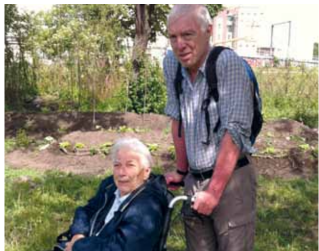
JEDER IST WILLKOMMEN IM INTERKULTURELLEN GARTEN