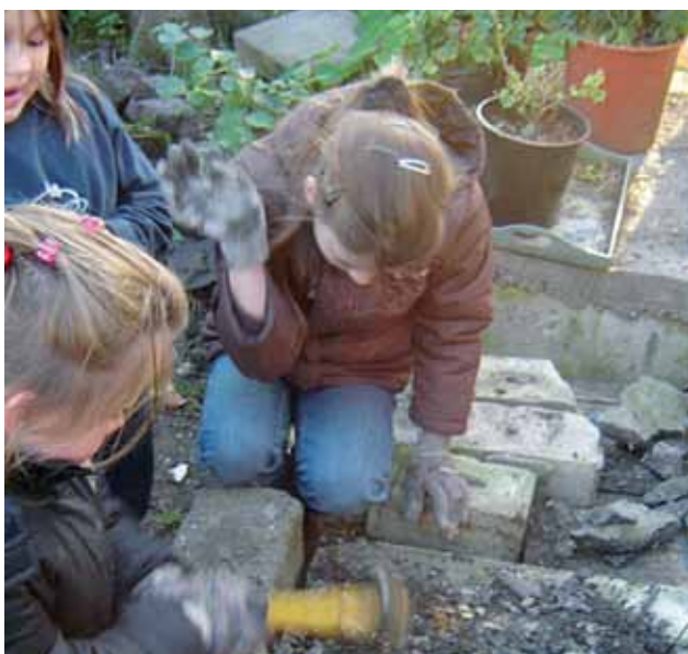
DIE MÄDCHEN BEI DER ARBEIT

Partizipation wird hier großgeschrieben: Die Mädchen bestimmen selbst, wann was wo gemacht wird. Wenn die Mädchen keine Lust auf Gießen haben, dann lassen sie es eben – lernen dann aber auch unmittelbar die Konsequenzen kennen. Die Betreuerinnen sehen immer wieder, wie sich die Fähigkeiten der Mädchen im Bereich der Partizipation mit der Zeit verändern: Zunächst empfinden die Mädchen Partizipation noch als fremd und eine häufige Antwort auf Fragen zu Gestaltungswünschen lautet: „weiß ich nicht“. Doch nach recht kurzer Zeit beginnen sie mitzudenken, Ideen zu entwickeln und sind dann auch sehr kreativ darin, ihre Ideen mit geringstem Budget umzusetzen. Für den Umbau ihres Bauwagens stellten sie z.B. selbst einen Fördermitelantrag, planten und bauten ihn selbstständig um. Und nicht nur der Garten selbst ist interessant: Verstimmt vom eher schlechten Ruf des eigenen Stadtteils zogen die Mädchen mit Kameras los, um schöne Stellen zu fotografieren – heraus kam ein kunterbunter Bildband, der ein ganz anderes, positives Bild von Schalke zeigt.