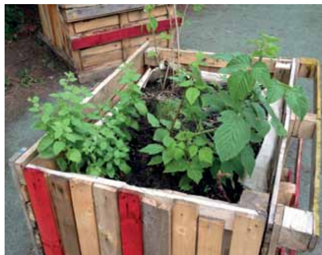
GEMÜSEBEET IM GEMEINSCHAFTSGARTEN GLOGAUER