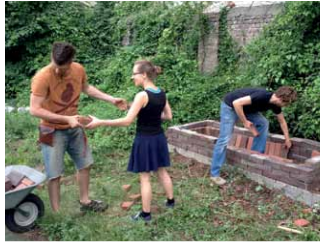
BEETEBAU IM GEMEINSCHAFTSGARTEN GLOGAUER