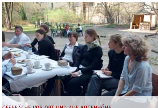
GESPRÄCHE VOR ORT UND AUF AUGENHÖHE