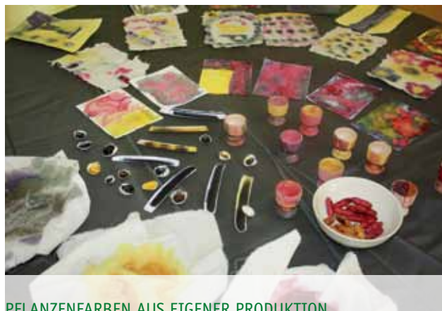
PFLANZENFARBEN AUS EIGENER PRODUKTION