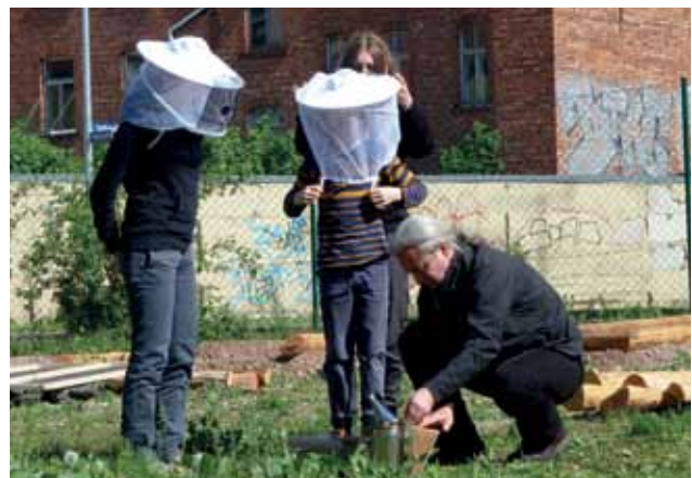
BIENENPROJEKT IM INTERKULTURELLEN GARTEN ERFURT