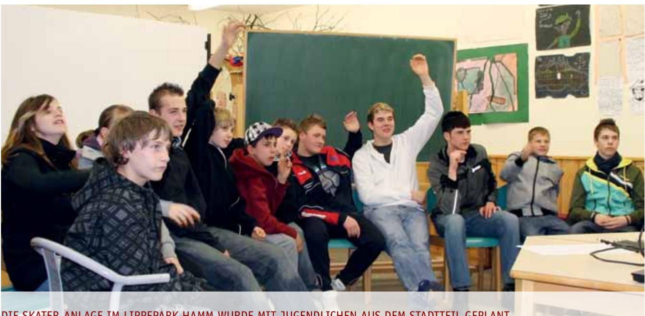
DIE SKATER-ANLAGE IM LIPPEPARK HAMM WURDE MIT JUGENDLICHEN AUS DEM STADTTEIL GEPLANT