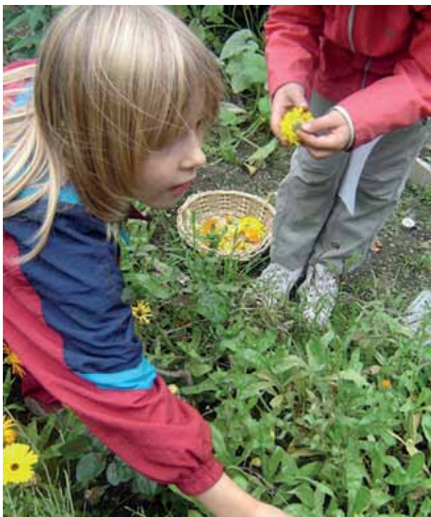
BEI DER FÄRBERPFLANZENERNTE IM MÄDCHENGARTEN

Gerade Kinder haben viel Freude daran, die Entwicklung von selbstgesättem Gemüse zu beobachten und selbst ernten zu können. Bei Jugendlichen steht bei solchen Aktivitäten meist weniger die Gartenarbeit im Vordergrund, doch gibt es andere Aktivitäten, die ihnen Spaß machen, wie z.B. der Bau von Sitzgelegenheiten oder das Anlegen von Aufenthaltsräumen im Freien.