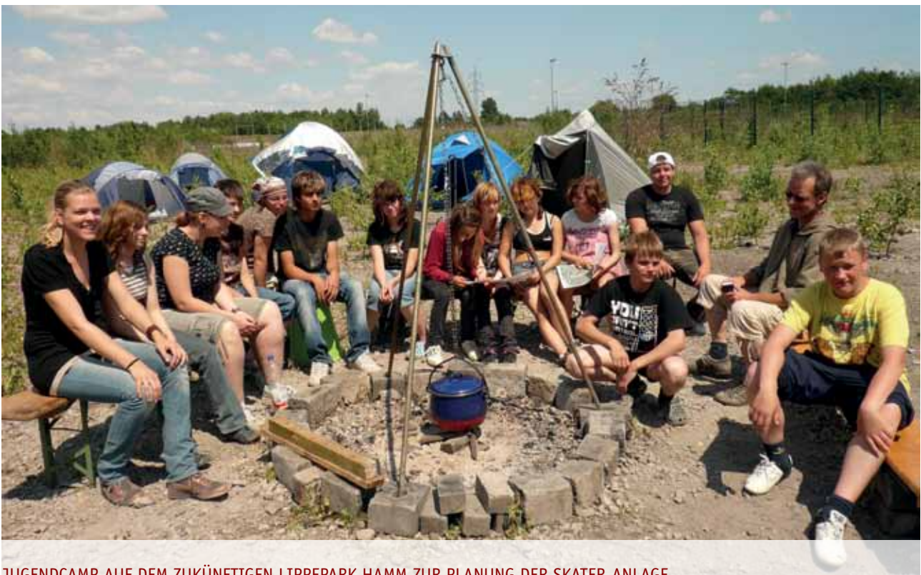
JUGENDCAMP AUF DEM ZUKÜNFTIGEN LIPPEPARK HAMM ZUR PLANUNG DER SKATER-ANLAGE

In Bad Neuenahr-Ahrweiler wurden in jedem Ortsteil mit Kindern und Jugendlichen Zukunftswerkstätten durch-