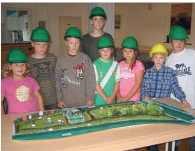
KINDER-STADTPLANER MIT EIGENEM MODELL

Kontakt: Katja Meusel, Stadtplanungsamt der Stadt Hamm, meusel@stadt.hamm.de